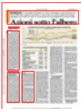
TAVOLA ROTONDA Un bel regalo di Natale? Un titolo. Nonostante i maxi-rialzi da cui sono reduci, per i gestori sul listino ci sono nomi con molte chance di ulteriori guadagni. Ecco tutte le scelte e le previsioni di sei protagonisti di Piazza Affari