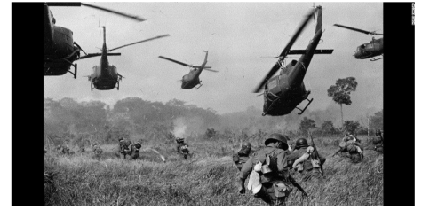
Il Vietnam fa esplodere la spesa pubblica.

Se le cose stanno così, l'inflazione è ancora lontana almeno due anni. In questi due anni l'unica arma a disposizione per contenere la fisiologica voglia di sedersi di un ciclo espansivo che è in piedi da dieci anni continuerà dunque a essere quella monetaria. Altro Qe e tassi bassi, non importa se sempre più negativi. La ricetta è sempre quella e se occorre ci si metterà più sale, magari facendo Qe anche sulle borse e non solo sui titoli governativi.