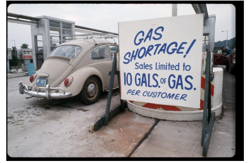
Crisi petrolifera. 1973.

Ci sono segnali di cambiamento vero, dunque, ma le resistenze sono formidabili. L'Europa continua a teorizzare l'austerità fiscale e la liberalizzazione del mercato del lavoro come madre di tutte le riforme, mentre fra poco si ritroverà anche a fronteggiare le pressioni deflazionistiche