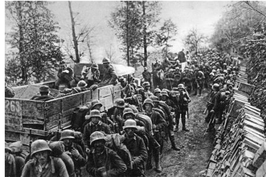
Avanzata austriaca a Caporetto. 1917.

Si riparla di tassi negativi. Questa volta profondi.