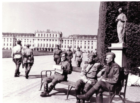
L'Armata Rossa a Vienna. 1945.

La prima è che l'America di Trump rifiuta l'idea che il ciclo, fisiologicamente, rallenti e vuole tenerlo in piedi a tutti i costi. Da qui l'idea di tagliare i tassi aggressivamente anche se il Pil continua a crescere, c'è piena occupazione e le borse sono sui massimi di tutti i tempi. Se in tempi ancora relativamente buoni si vuole che i tassi scendano dal 2.5 all'1.5 o