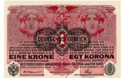
La corona imperiale verrà sostituita dallo sellino dopo l'iperinflazione. 1925.

Quanto alla domanda su che senso abbia comprare un bond a cento anni a 163, la risposta è questa. Se i rendimenti dovessero calare di un altro punto e, nel caso del nostro bond, andare quindi a zero, l'Austria 2117 dovrebbe valere 306. Se dovessero calare di due punti, il nostro bond andrebbe a 621. Se poi, alla prossima recessione, dovessimo adottare quei tassi profondamente negativi che stanno tornando di moda nel dibattito tra banchieri centrali, per vedere l'Austria quotare a 1385 (quasi 14 volte il prezzo di emissione) basterebbe un rendimento a scadenza del meno due per cento.