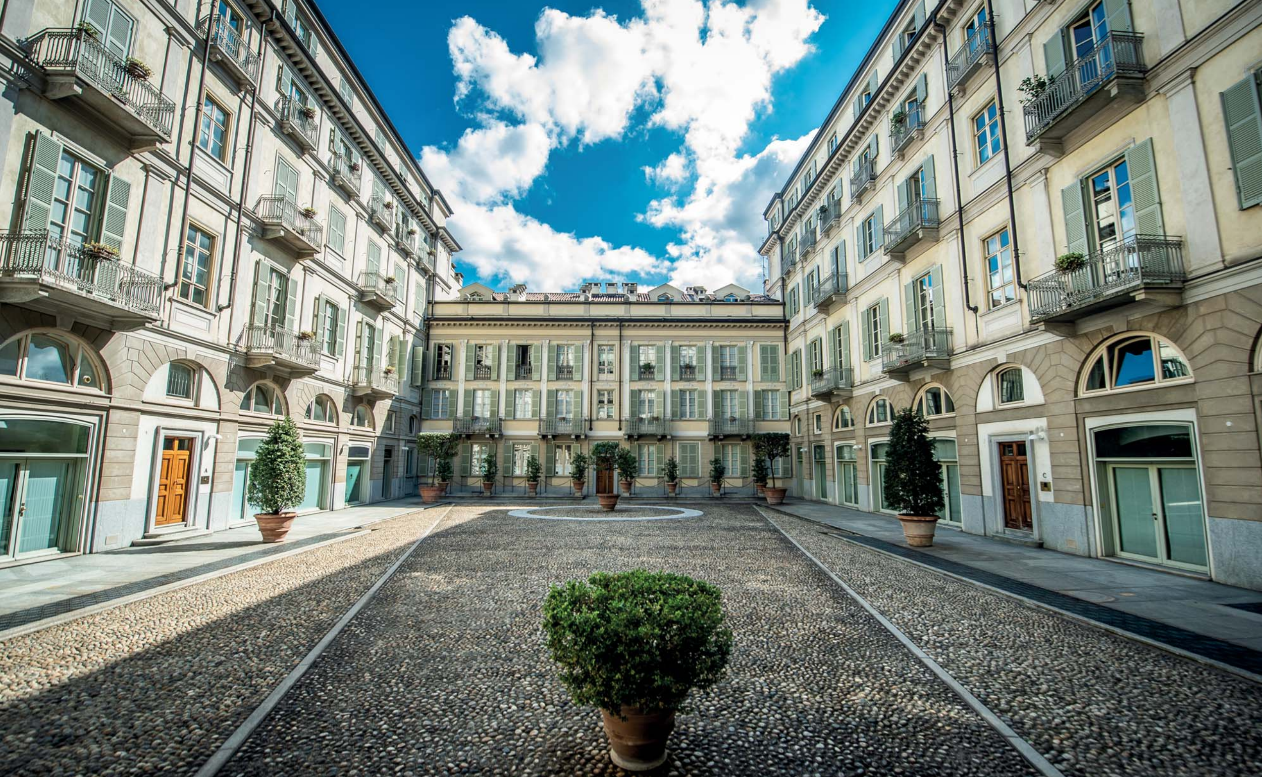
La sede di Torino in via della Rocca