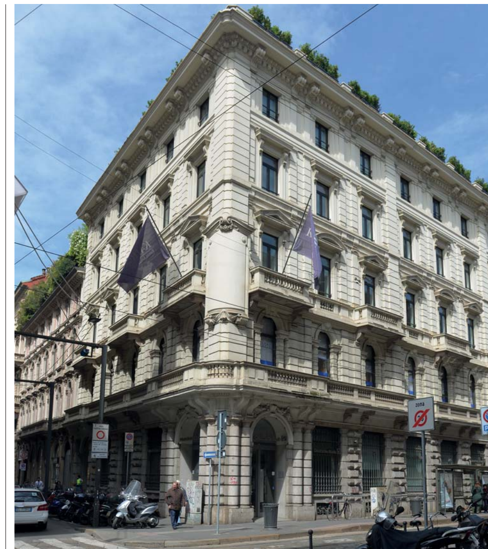
La sede di Milano

Kairos nasce come un'iniziativa imprenditoriale e, in quanto tale, è riconosciuta come un punto di riferimento per accompagnare gli imprenditori nella scelta più opportuna di prodotti e servizi utili alla gestione del capitale e allo sviluppo d'impresa