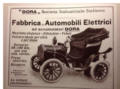
L'auto elettrica italiana Dora

La concentrazione dell'industria americana continua a salire. L'indice Herfindahl-Hirschman che la misura (sommando il quadrato della quota di mercato delle singole imprese) è cresciuto del 50 per cento dal 2000 a oggi. Secondo i calcoli dello studio questo aumento di concentrazione permette alle imprese sopravvissute di scaricare sui loro