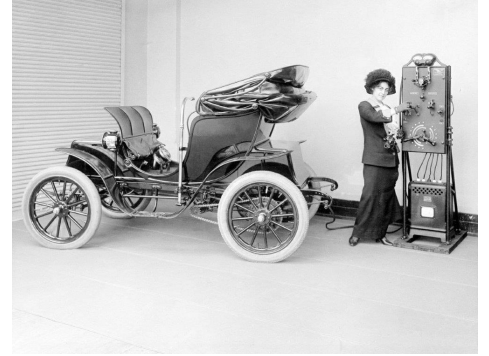
Auto elettrica in ricarica

In altre parole molti settori tradizionali sono hanno oggi un pricing power, in tempi di inflazione galoppante, non inferiore a quello dei semimonopoli della tecnologia. Buoni margini, costi sotto controllo, crescita costante, pricing power elevato e multipli molto bassi li rendono particolarmente interessanti in un momento impegnativo per l'economia globale e per i mercati finanziari.