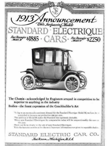
Auto elettrica. 1913. Costo equivalente a 60mila dollari attuali

In vista del trionfo dell'auto elettrica e dell'uso universale delle batterie per la transizione energetica, i mercati hanno spinto al rialzo il cobalto, il litio e il nickel. Una tonnellata di litio, scambiata nel 2020 a un prezzo medio di 8mila dollari, è arrivata a 21mila l'anno scorso e a 60mila quest'anno. Con una domanda che cresce del 30 per cento l'anno, hanno pensato molti investitori, il litio è una scelta da fare a occhi chiusi.