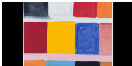
Stanley Whitney. Off Minor . 2013

resto del mondo. La seconda è la promessa di ridurre drasticamente, se non azzerare, l'immigrazione clandestina. La terza è l'impegno a rinnovare i tagli fiscali decennali del 2017, che i democratici lascerebbero invece scadere nel 2027.