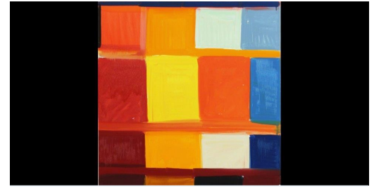
Stanley Whitney. Dance the Orange. 2013