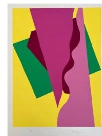
R. Mortensen. Composizione. 1975

Se è legittimo immaginare che i progressi della tecnologia abbasseranno il costo unitario dei token, il loro utilizzo totale continuerà a crescere esponenzialmente man mano che l'AI sarà chiamata a rispondere a problemi più complessi. Al punto che, nella scrittura di alcuni tipi di programmi software, gli umani potrebbero tornare a essere competitivi rispetto all'AI.